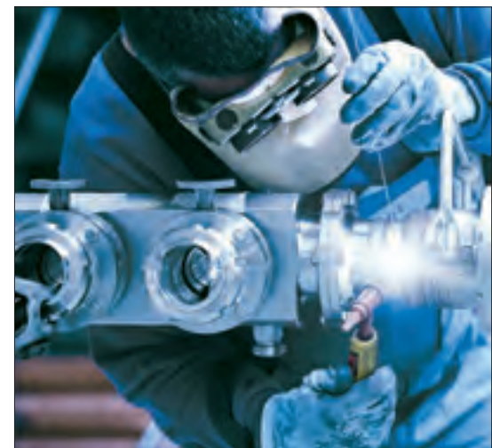
Montage von Rohrleitungen für Prozesanlagen.

Heute ist die JAG ein führendes Unternehmen in der Branche, das für die Pharma-, Biotech- und Lebensmittelindustrie anspruchsvollste Prozesanlagen und Au-