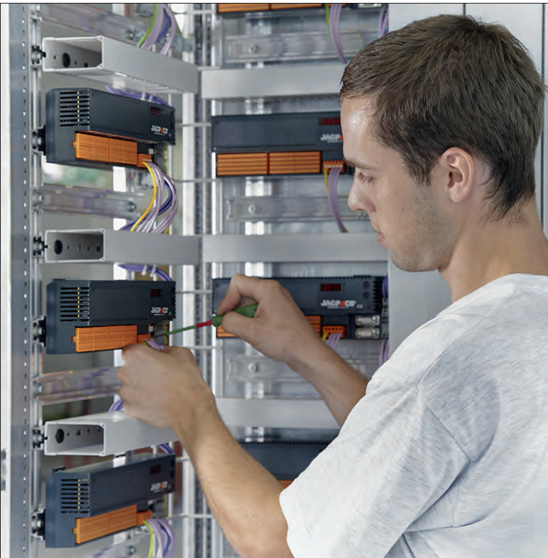
Montage von Steuerschränken für die Automation von Prozessanlagen.

tomationslösungen plant, baut und betreut. Eine eigene spezialisierte Systemlösung ermöglicht kürzeste Implementierungszeiten sowie eine ungewöhnlich hohe Automatisierung von Produktionsprozessen. Verfahrenstechnische Lösungen, Systemkomponenten und Prozesssteuerungen integriert die Firma zu schlüsselfertigen und hoch automatisierten Produktionsanlagen. Zu den Leistungen gehören Analyse, Planung und Bau von schlüsselfertigen Produktionsanlagen, deren Inbetriebnahme und Qualifizierung sowie Wartung und Systemsupport. Daneben hat man eigene Komponenten für die Realisierung von Prozessschritten wie Fördern, Dosieren, Mischen, Trennen und Reinigen entwickelt, die höchste Anforderungen erfüllen. Das Unternehmen hat den Hauptsitz in Brügg bei Biel sowie eine Niederlassung in Pruntrut. Im Weiteren gehören zwei Tochterfirmen in der Schweiz sowie eine eigene Niederlassung in Melbourne zur JAG-Gruppe. Insgesamt sind etwa 150 Mitarbeiter in der Schweiz beschäftigt.