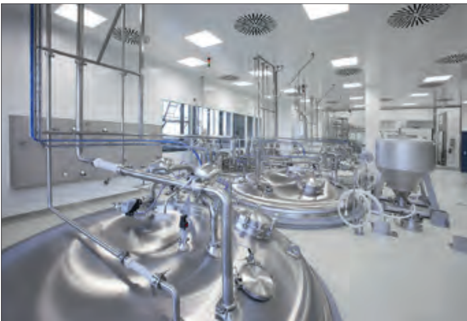
JAG plant und baut schlüsselfertige Prozesanlagen für die die Pharma-, Biotech- und Lebensmittelindustrie.