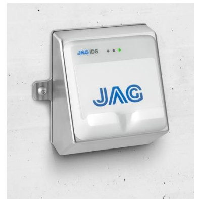
JAG IDS Leser für Wandmontage