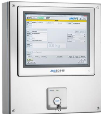
JAG IDS Leser Einbauversion