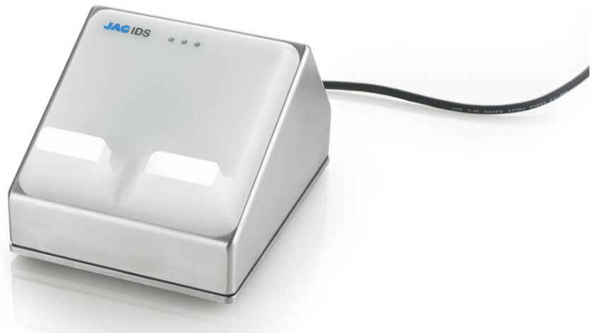
JAG IDS Desktop USB